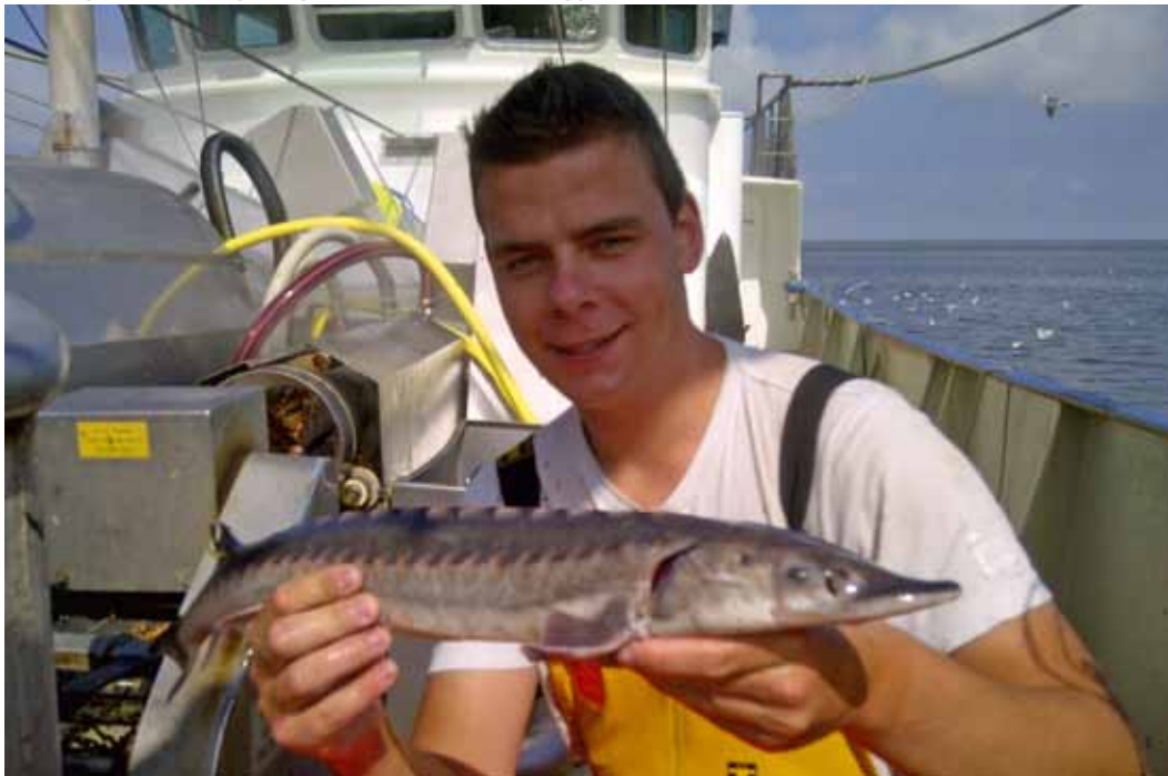
Een uitgezette steur gevangen en weer levend teruggezet.

Helaas blijkt dat ondanks vele inspanningen nog steeds Atlantische steuren gevangen worden en