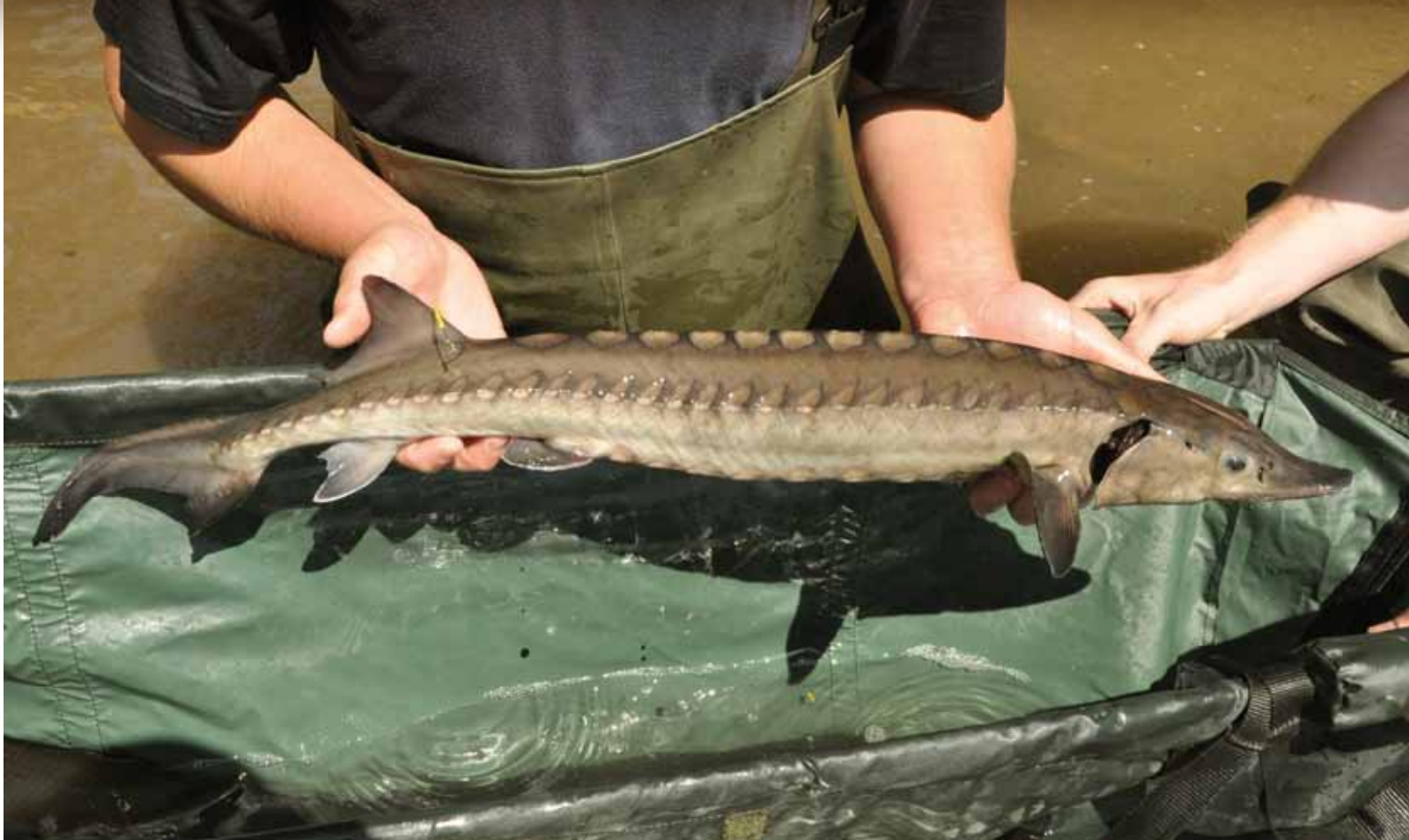
Een Atlantische steur voorzien van een merk en klaar om uitgezet te worden.