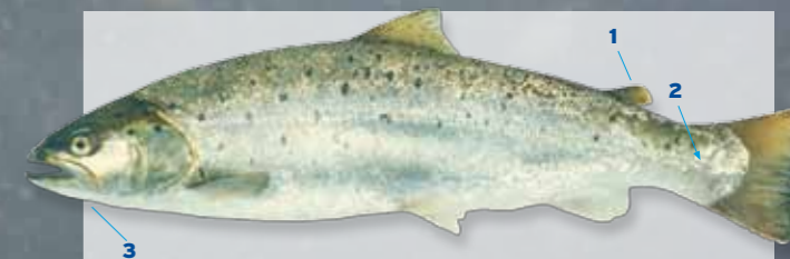
Zeeforel Salmo trutta trutta Lengte tot ca. 140 cm

Herkenning 1 Heeft een vetvin. 2 Tussen de achterkant van de vetvin en de zijlijn liggen, geteld in de richting van de aangegeven pijl, 14-17 rijen schubben. 3 De bovenkaak loopt door tot achter het oog. Op het lichaam komen zwarte, min of meer kruisvormige vlekjes voor. De zeeforel is de trekkende vorm van de forel. Kan worden verward met de zalm.