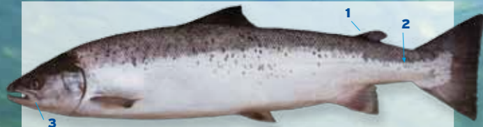
Atlantische zalm* Salmo salar Lengte tot ca. 150 cm

Herkenning 1 Er is een vetvin aanwezig. 2 Tussen de achterkant van de vetvin en de zijlijn liggen, geteld in de richting van de aangegeven pijl, 10-13 rijen schubben (de schub op de zijlijn niet meegeteld). 3 De bek loopt door tot onder het oog.