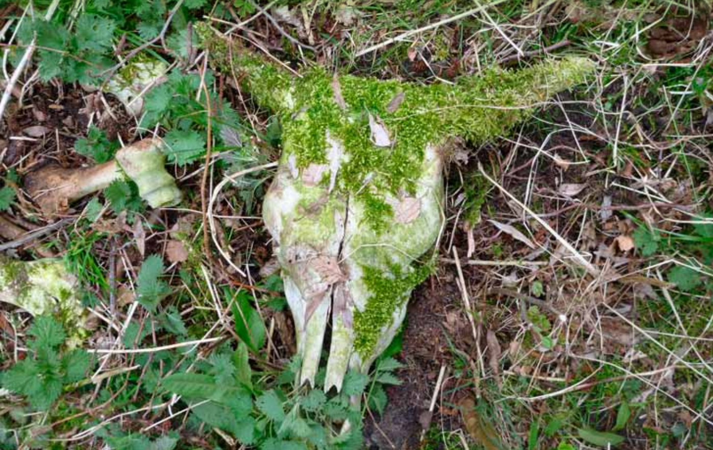
Zware botten vormen jarenlang een bron van mineralen. Botten die verspreid worden door carnivoren.