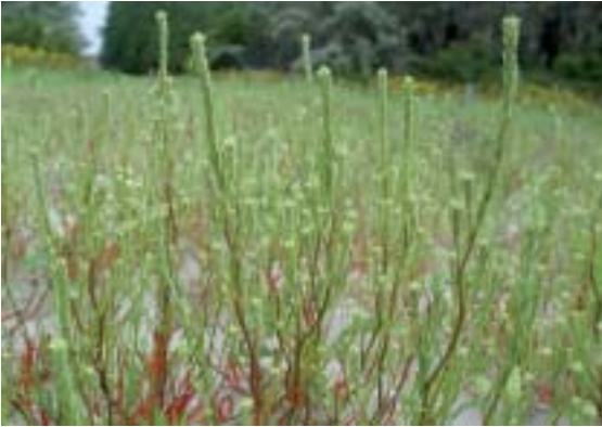
Sommige soorten, zoals smal vlieszaad, zijn juist te vinden op industrieterreinen die regelmatig op de schop gaan.