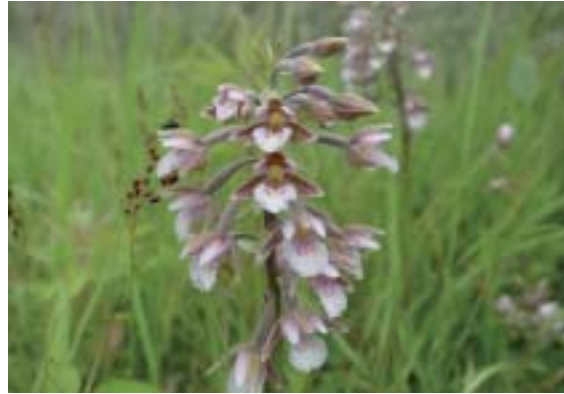
Moeraswespenorchis, een vroege soort, verschijnt pas als de juiste bodemschimmel aanwezig is en verdwijnt weer als zijn leefgebied overgroeid raakt door struweel.

VROEGE SOORTEN zijn soorten die gebonden zijn aan jonge successiestadia, maar ze reageren niet zo snel als pioniers. Vanwege een lagere reproductiesnelheid of geringere mobiliteit hebben ze wat meer tijd nodig om een populatie op te bouwen. Net als pioniers zijn vroege soorten gebaat bij grootschalige, liefst natuurlijke dynamiek. Maar ook tijdelijke natuurgebieden voldoen, mits ze enige jaren bestaan; ze fungeren dan als een stepping stone en brongebied (figuur 1, curve 2-3).