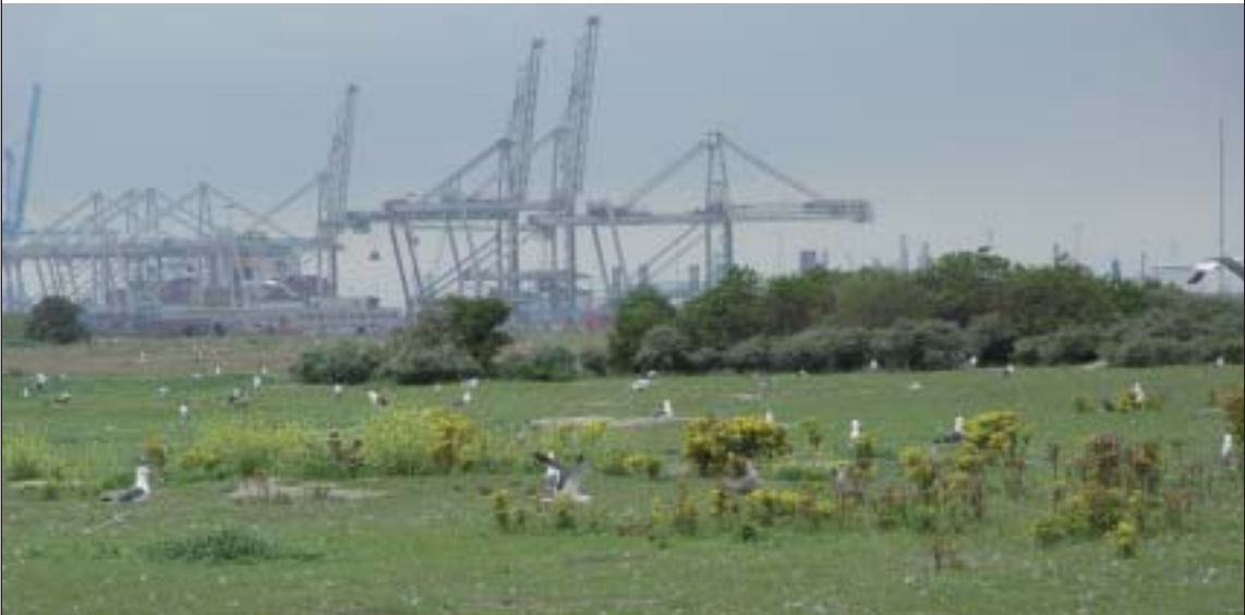
Meeuwenkolonie op de Maasvlakte. Een havenbedrijf, met al zijn natuurlijke en menselijke dynamiek, oefent een grote aantrekkingskracht uit op pioniers als meeuwen

goed bij. De realiteit is echter anders. De Flora- en faunawet staat niet zonder meer toe dat de natuur, die zich spontaan op de braakliggende gronden ontwikkelt, na enkele jaren weer verwijderd wordt. Ook niet wanneer de grond eigenlijk een industriële bestemming heeft. Dan moet er ontheffing worden aangevraagd, gecompenseerd en gemitigeerd worden met alle procedurele rompslomp van dien. Dit weerhoudt het havenbedrijf ervan om spontane natuurontwikkeling toe te laten. De braakliggende gronden worden dusdanig beheerd dat er geen natuur van noemenswaardige betekenis kan ontstaan.