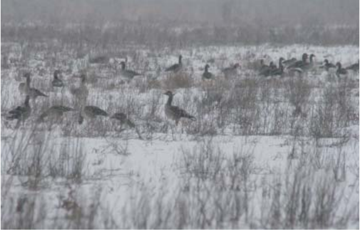
Tijdelijke natuur op voormalige akkers trekt de hele eerste winter lang ganzen aan die op oogstresten af komen.

OVERWINTERAARS. Voedselrijke graslanden en plasdras staande terreinen kunnen grote aantallen, overwinterende vogels aantrekken. In tijdelijke natuurgebieden zijn deze soorten welkom en ze worden er niet verjaagd. Echter, de ruigte neemt in tijdelijke natuurgebieden langzaam toe en de voedselrijkdom af, waardoor de draagkracht voor grazende vogels in de loop van de tijd vermindert (figuur 1, curve 2-4).