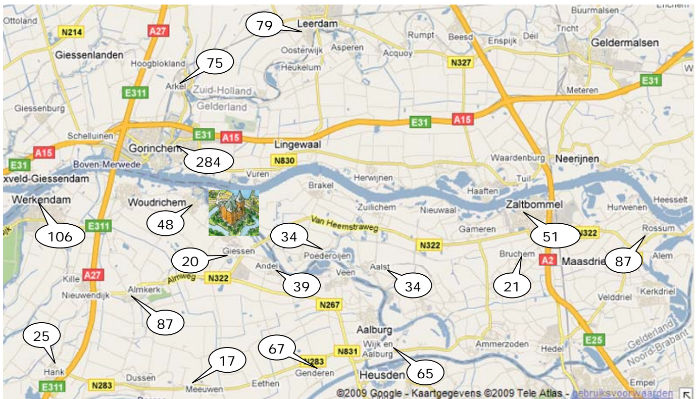
Hier kwamen de kinderen vandaan die in 2009 deelnamen aan de natuurexpedities