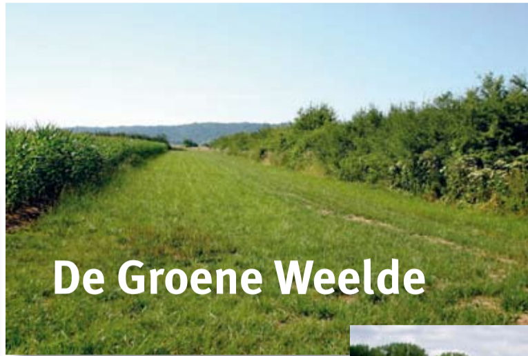
De Groene Weelde